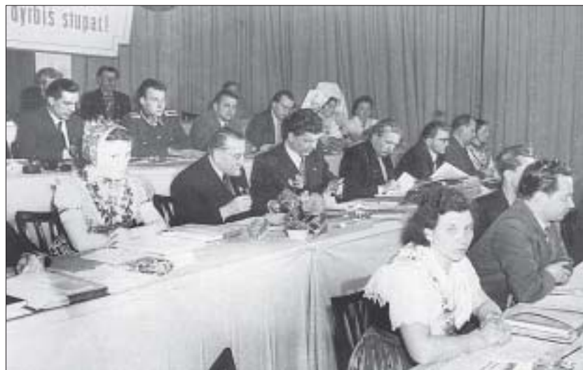
Präsidium des IV. Bundeskongresses der Domowina im März 1957