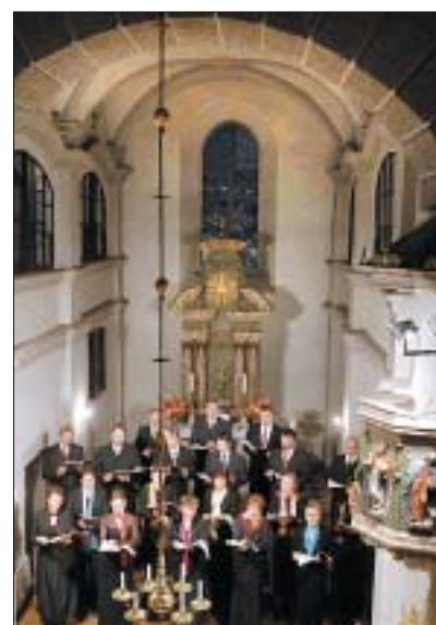
Der Chor des Sorbischen-Nationalensembles konzertierte auch in der Krebaer Kirche.