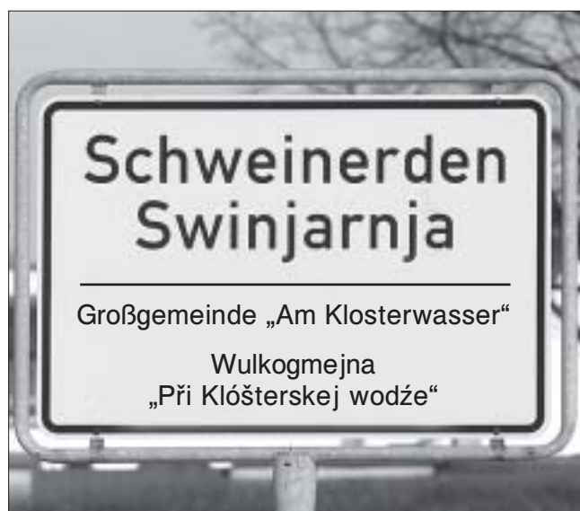
So würde zum Beispiel das Ortseingangsschild von Schweinerden bei Bildung einer Großgemeinde aussehen.

gegenüber den Serbske Nowiny. Außerdem meint auch er, dass zusätzliche Gelder heute zwar sehr verlockend seien. „Aber wer weiß, was in fünf Jahren ist?“