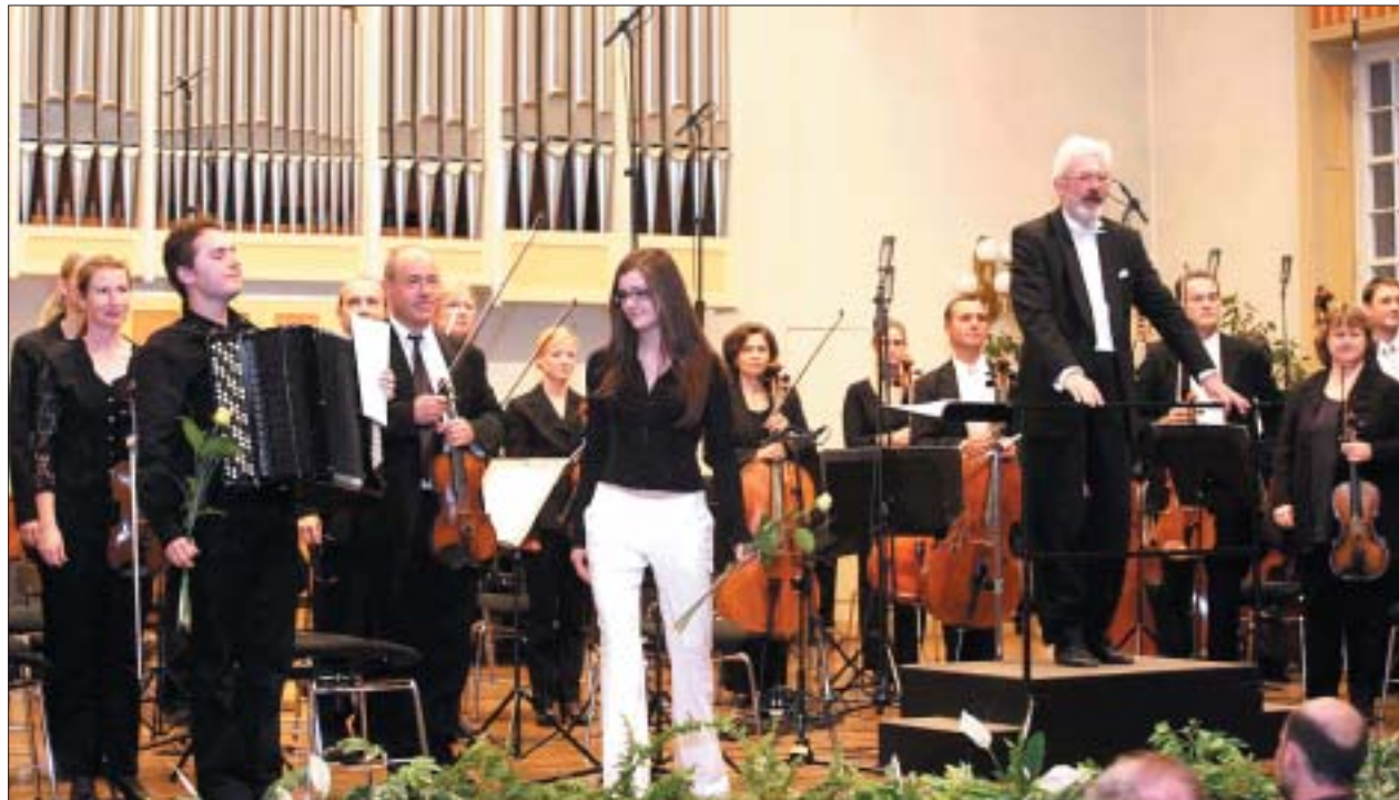
Das Preisträgerkonzert in Cottbus gestalteten Akkordeon-Solisten gemeinsam mit dem Philharmonischen Orchester Cottbus.

Preisträgerkonzert des RBB 2006 im Cottbuser Konservatorium